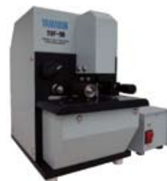
オフライン卓上型厚み計測装置（TOF-5R）