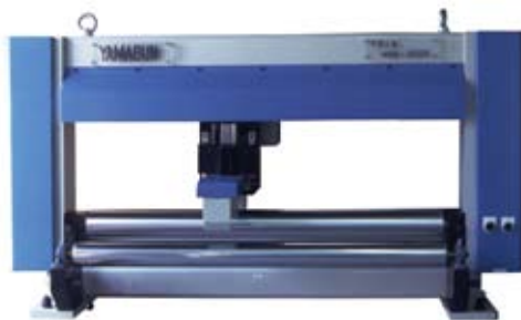
オンラインレーザ式厚み計測装置（NME-RM）

今後も、機能とコストのバランスのとれた厚さ計測および厚さ制御システムの開発を行い、名実共に厚さ計測分野でベストメーカーになる夢を実現させるべく、新規顧客を開拓している。